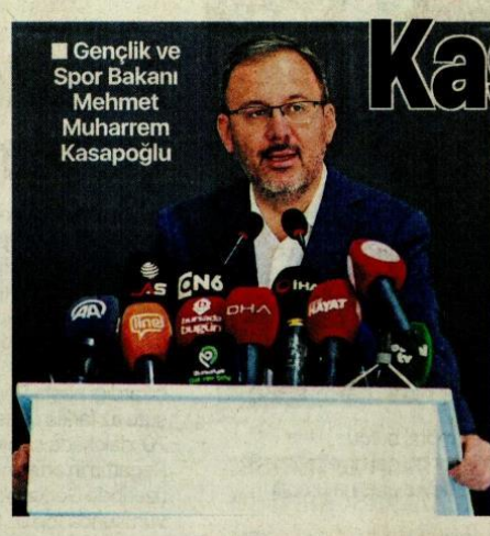
■ Gençlik ve Spor Bakanı Mehmet Muharrem Kasapoğlu