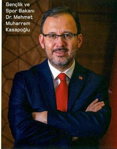
Gençlik ve Spor Bakanı Dr. Mehmet Muharrem Kasapoğlu

GENÇLİK ve Spor Bakanı Dr. Mehmet Muharrem Kasapoğlu, küresel ekonomik fırtınalardan gençlerin etkilenmemesi için, devletin tüm imkanlarının gençlerin emrinde olduğunu vurgulayarak, gençlerin hep yanında olduklarını, olmaya da devam edeceklerini söyledi. Büyük ve güçlü Türkiye'nin inşasında gençlerin, sahip oldukları vizyon, enerji ve dinamizmle "en önemli değer" olduğunun altını çizen Kasapoğlu, PARA Dergisi'ne yaptığı açıklamada "Genç kitleye hizmet üretiyorsanız; dinamik, çözüm odaklı ve hızlı aksiyon ortaya koyan bir yapıda olmalısınız. Gençlerin temsil ettikleri dünyayı, hayatı anlama biçimlerini, bakış açılarını ve gelecek perspektiflerini bir bütün olarak ele almalısınız. İşte, Bakanlık olarak çalışmalarımızdaki temel yaklaşımımız budur. Biz, gençlerimizin bedensel, ruhsal ve fikri gelişimi için destekleyici politikaları hayata geçirmeye gayret ediyoruz" dedi.