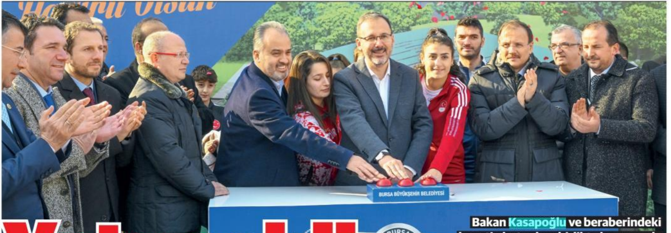
Bakan Kasapoğlu ve beraberindeki heyetin butonlara birlikte basmasıyla tesisin temelini ilk harc döküldü.